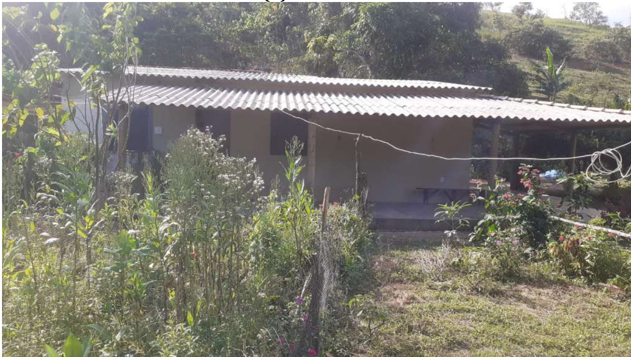
FIGURA 2: Registro fotográfico da vistoria.