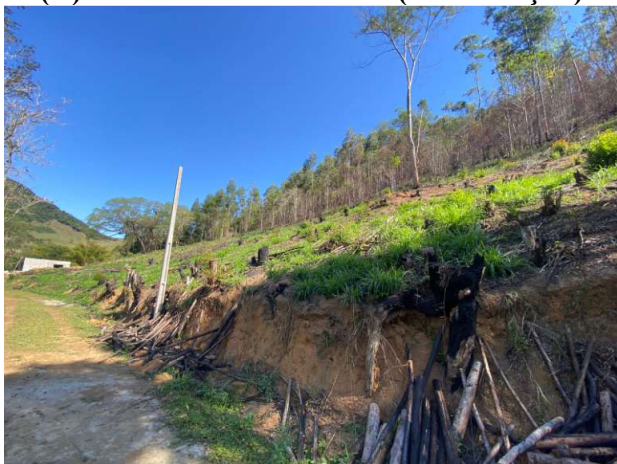
(E) Vista da área de corte (continuação)