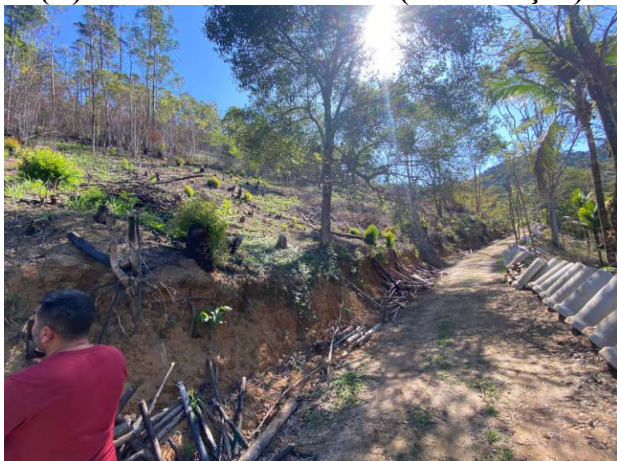
(C) Vista da área de corte (continuação)