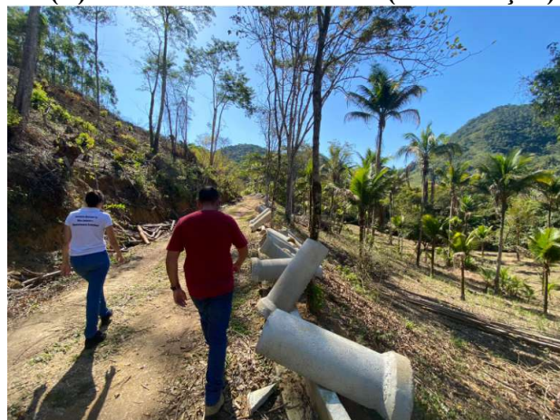
(F) Vista da área de aterro (continuação)