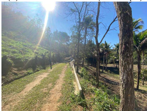
(D) Vista da área de aterro (continuação)