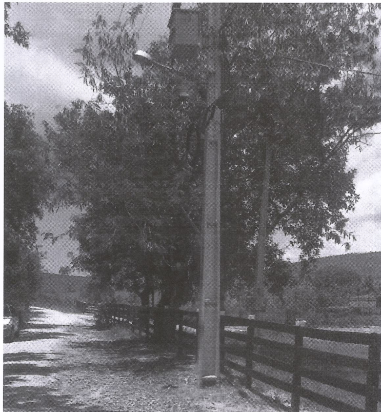
Imagem 02: Poste padrão de energia elétrica.