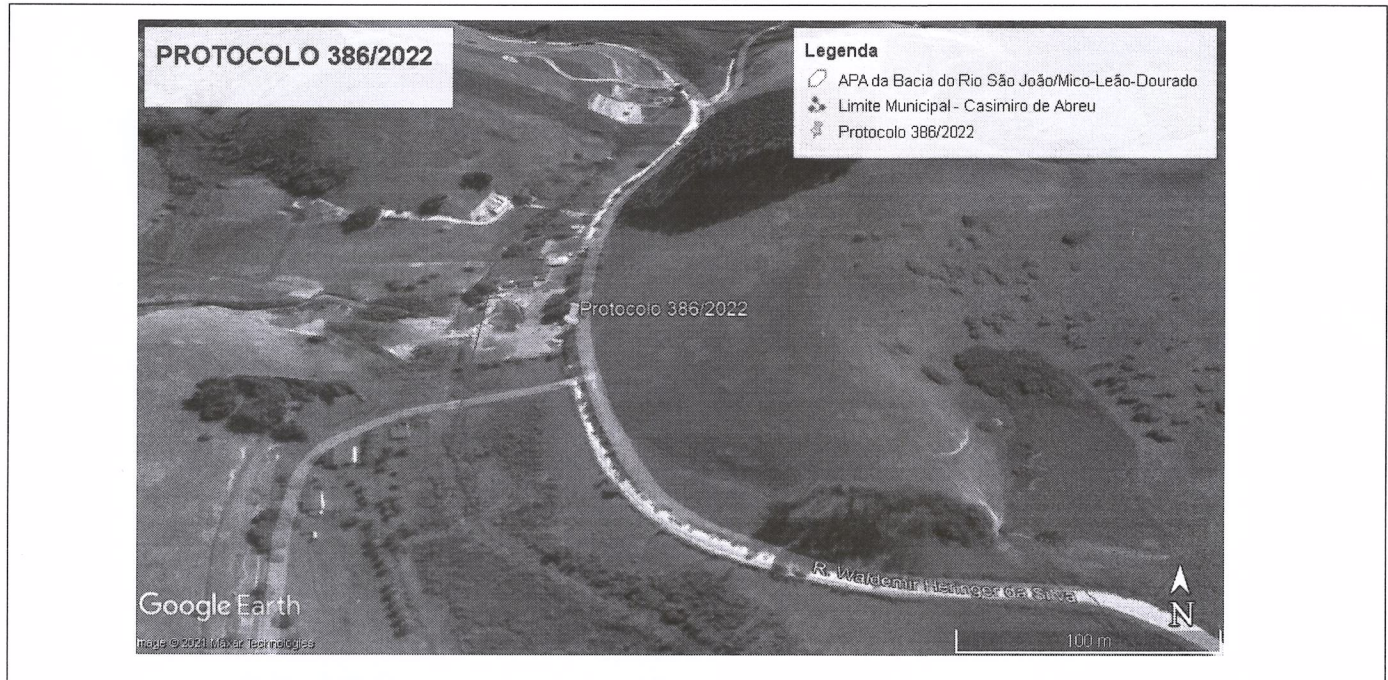
Imagem 01: Localização obtida através do Google Earth.