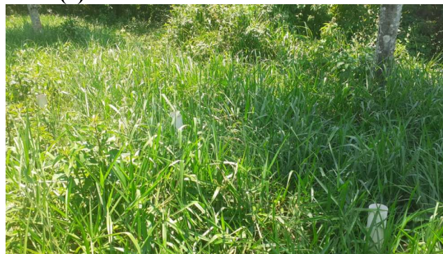
(L) VISTORIA CSAO