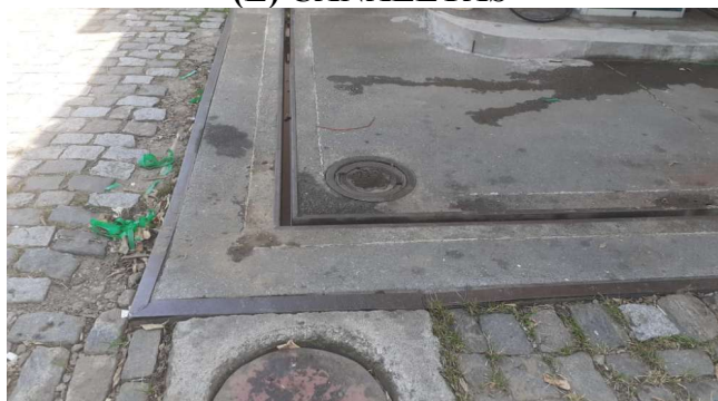
(G) TANQUE SUBTERRÂNEO