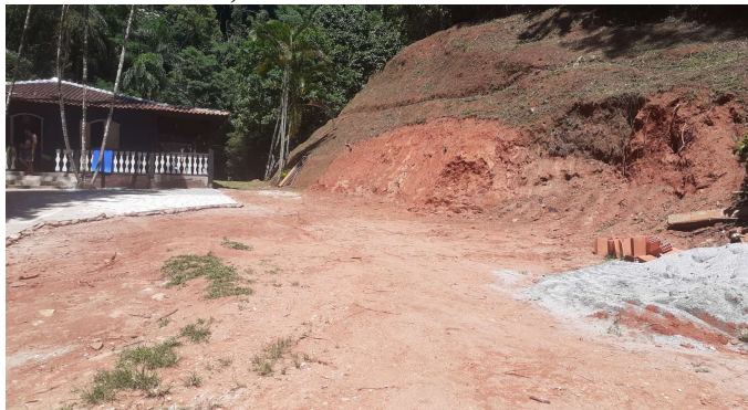
(A) área a ser instalada estrutura. APP Consolidada, estrutura a cerca de 30 metros.