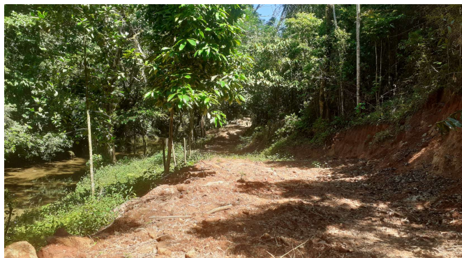
(C) Local a ser instalado estrutura provisória em via existente em APP.