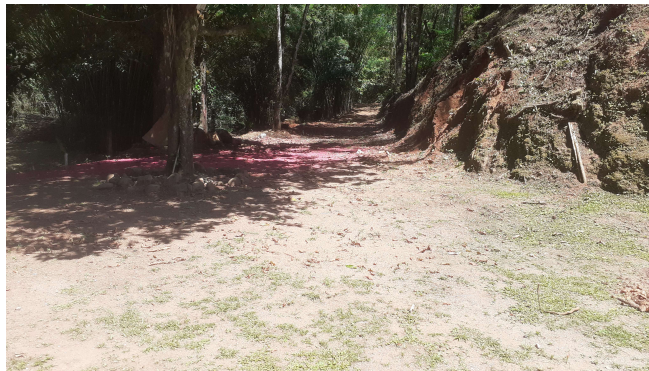
(B) Vista da via de acesso já existente