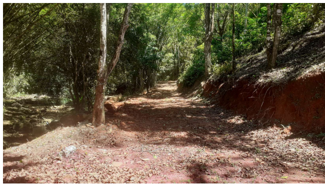
FIGURA 3: Registro fotográfico dos locais a serem instaladas as estruturas para produção de gogumelo.