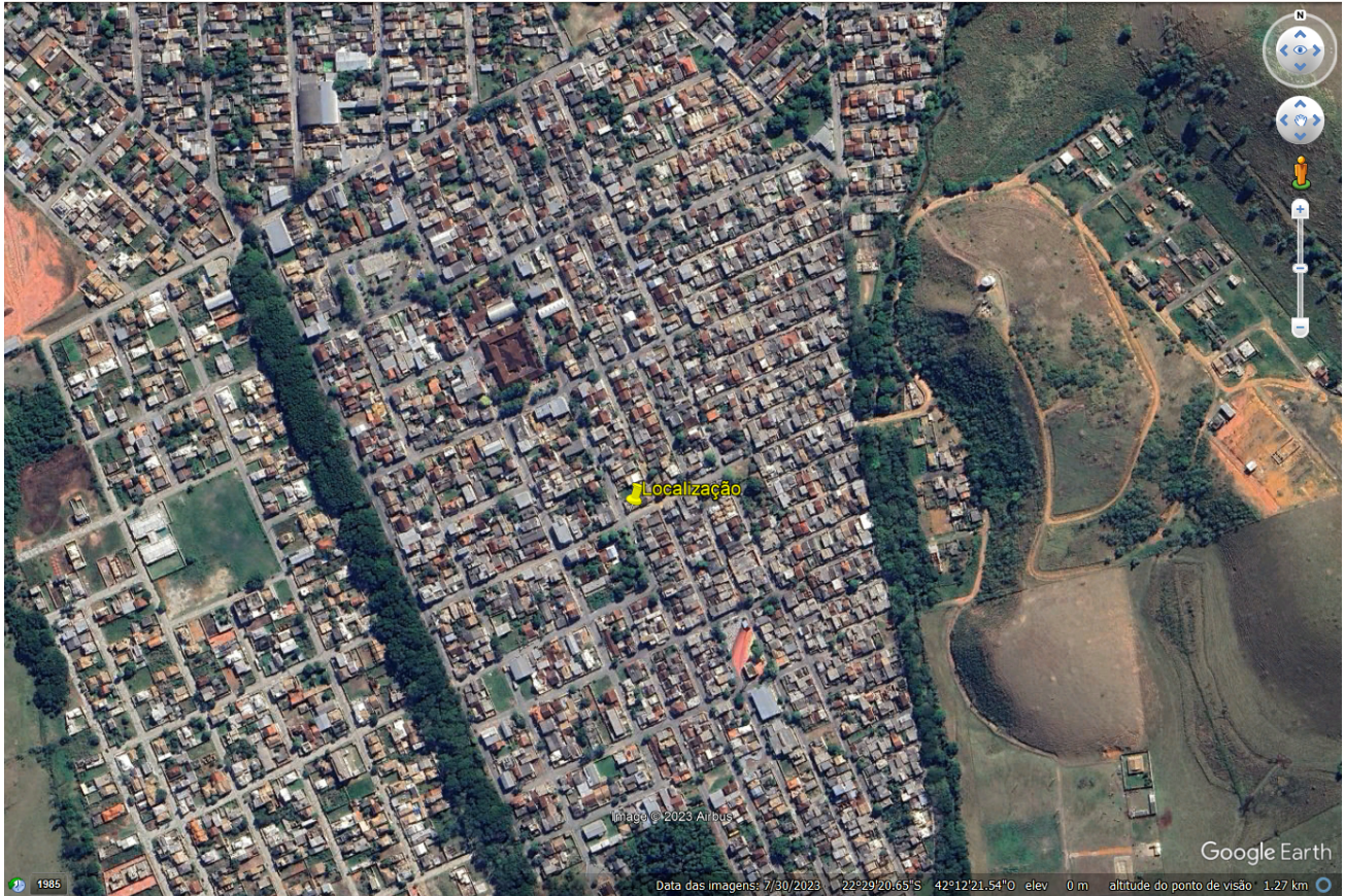
FIGURA 1: Localização.