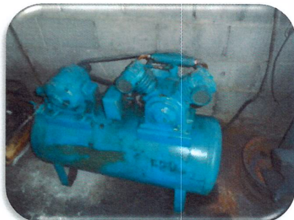
Compressor de Ar e Esmeril, respectivamente