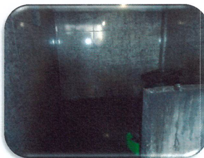
Área de localização do Sistema de Esgotamento Sanitário