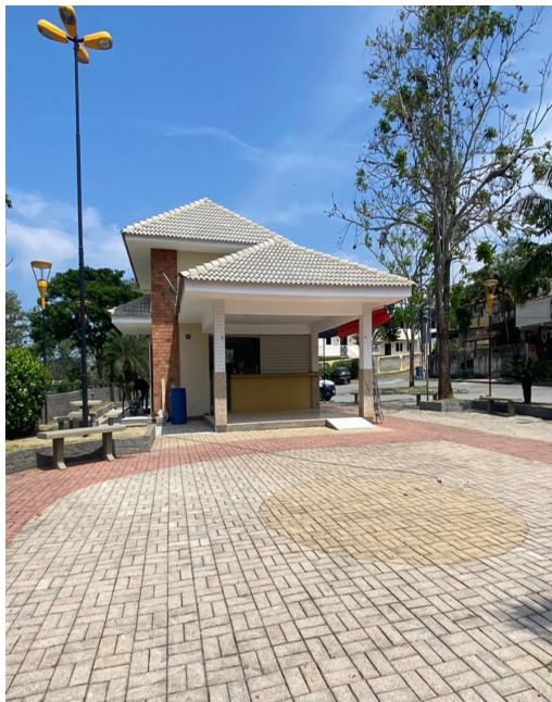
Casa de Cultura, Em frente a praça Lucio André, Casimiro de Abreu