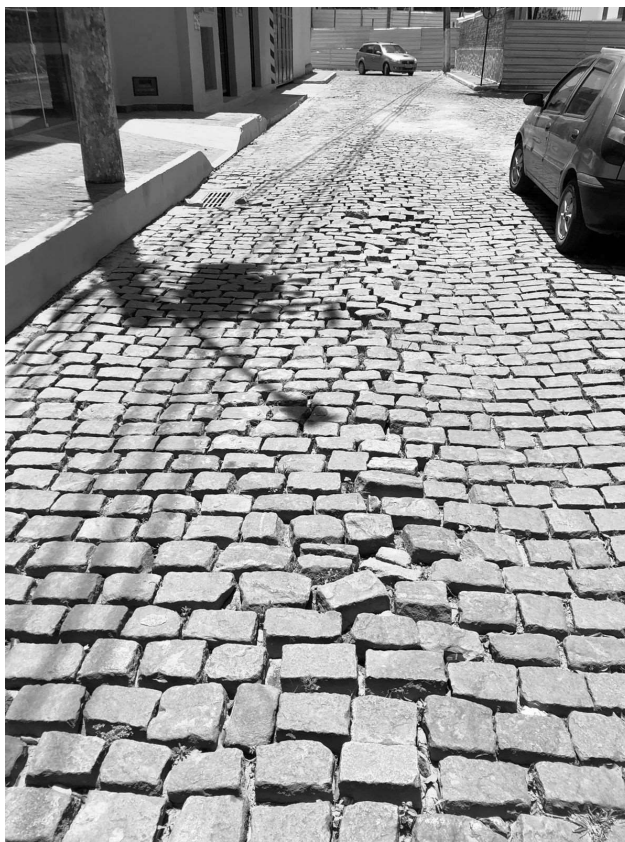
Rua Ataliba de Carvalho: