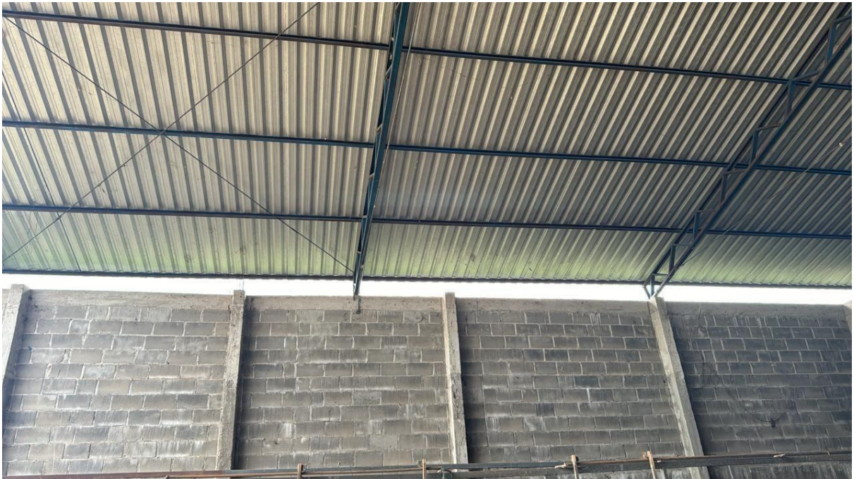
(estrutura metálica, blocos de concreto, pilares e vigas)