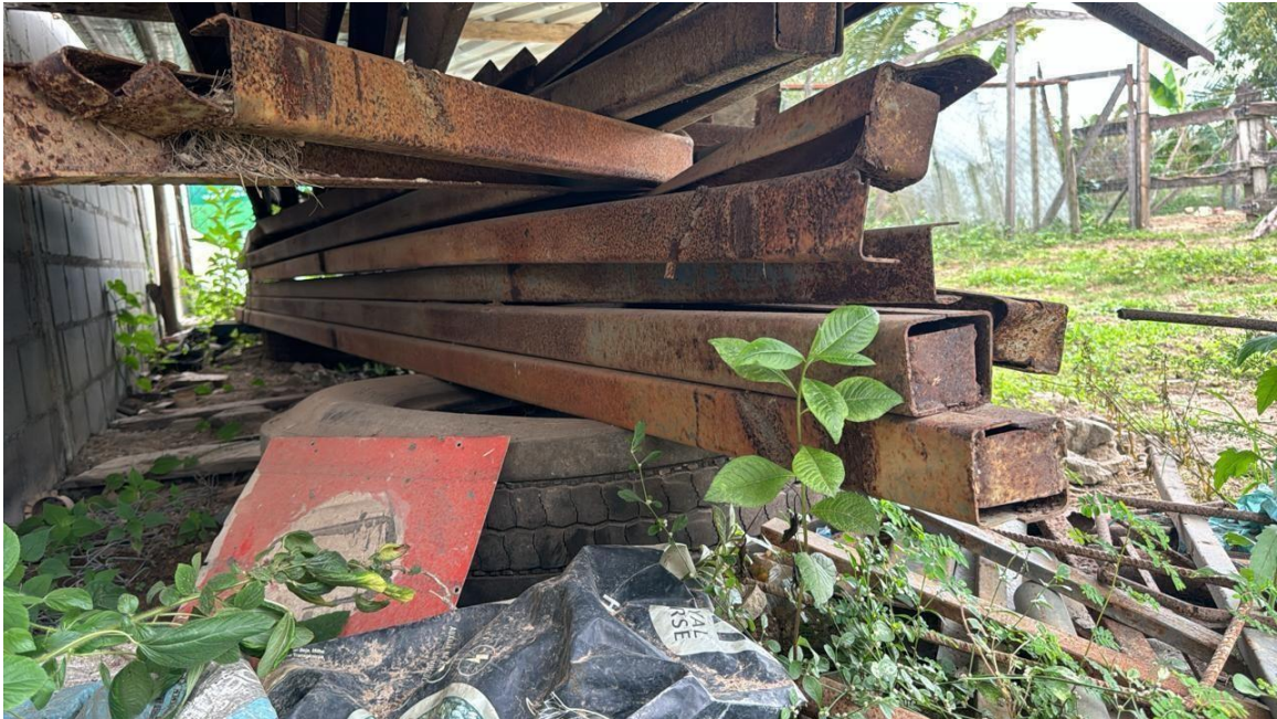
Foto realizada na presente data, 24/10/2024, comprovando que a estrutura metálica foi afetada devido o vento forte e chuva.

O galpão teve que ser refeito, tendo em vista os intemperes climáticas que ocorreram com fortes chuvas e ventos que danificaram a estrutura do antigo galpão retorcendo a estrutura metálica, telhas, afetando inclusive os blocos de concreto, como demonstrado nas fotos abaixo.