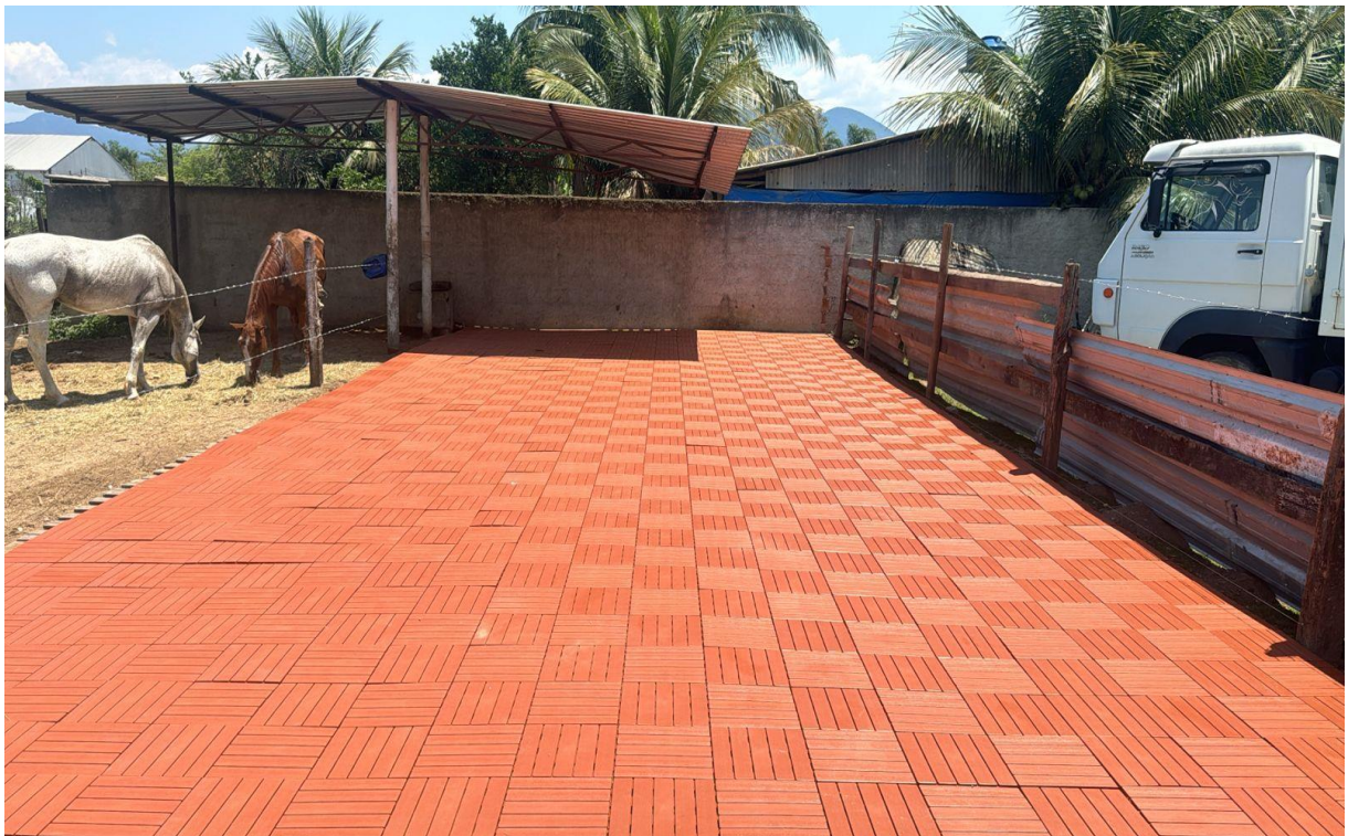
(Deck em madeira plástica)