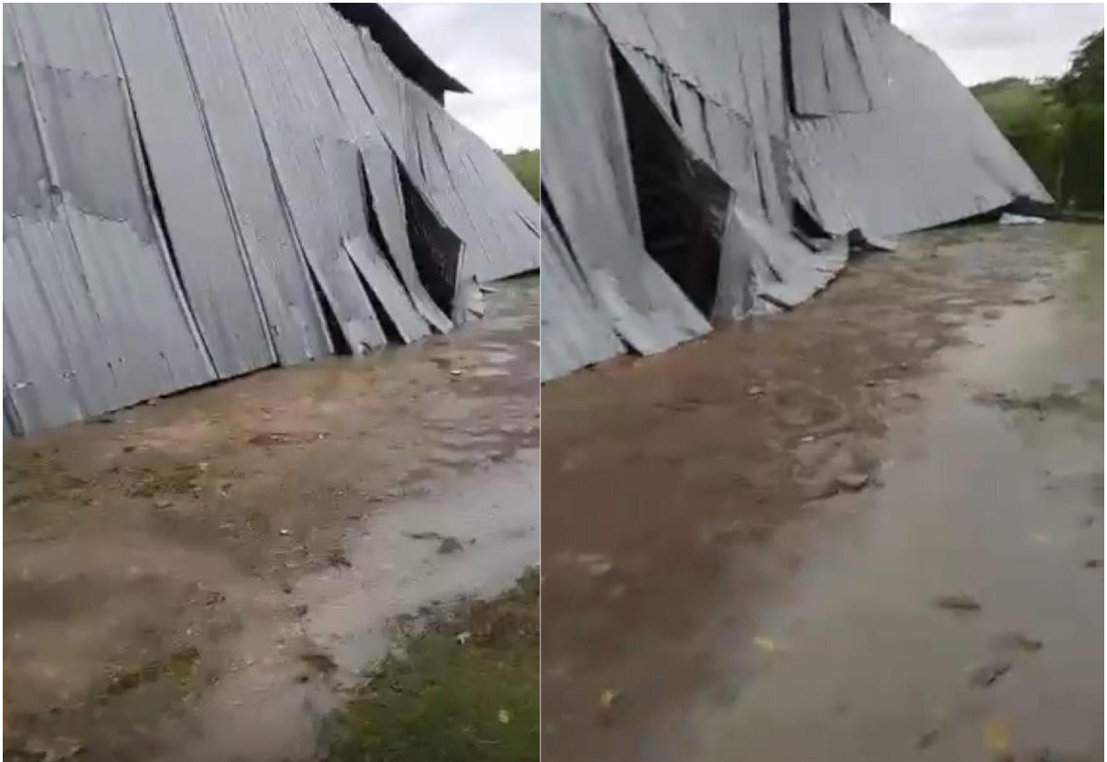
Foto de como ficou a lateral do galpão durante os fortes ventos e chuvas