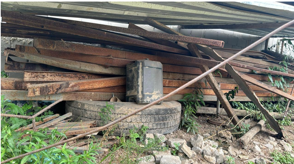
Foto realizada na presente data 24/10/2024 comprovando que a estrutura metálica foi afetada devido o vento forte e chuva.

Foto realizada na presente data, 24/10/2024, comprovando que a estrutura metálica foi afetada devido o vento forte e chuva.