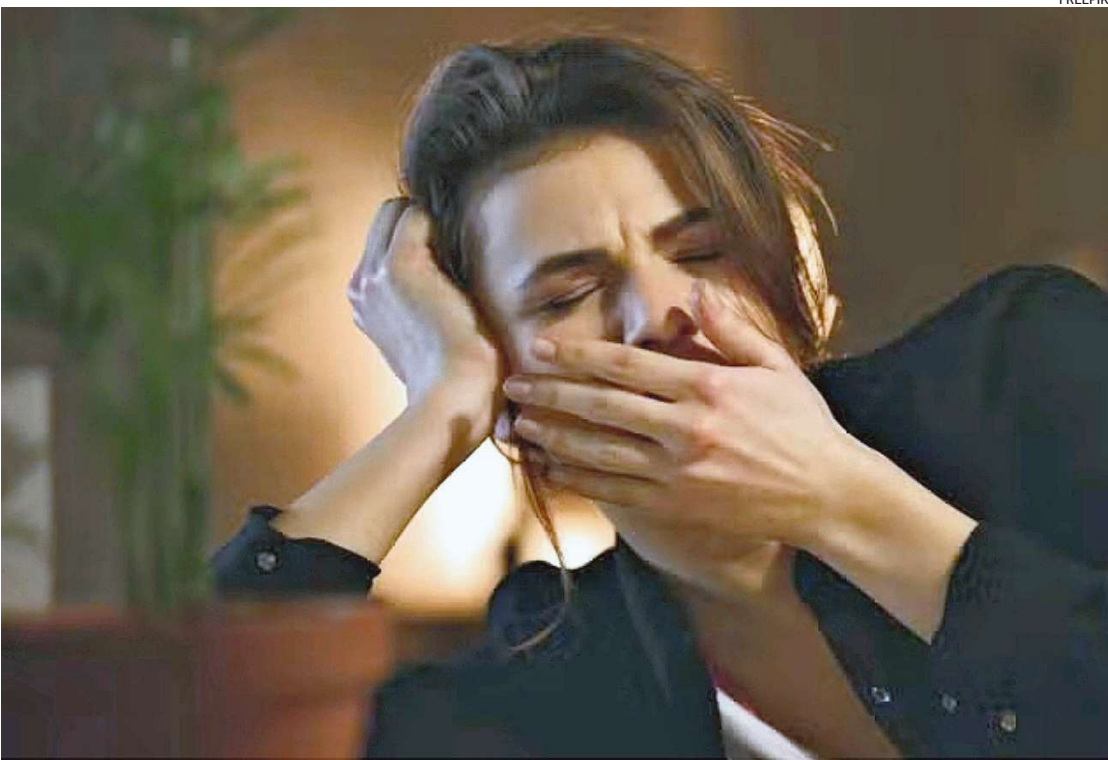
Cansaço e falta de energia: ter atenção com o cardápio ajuda a espantar os problemas

Atender às necessidades diárias de proteínas ajuda a manter os níveis de energia estáveis. É muito importante consumi-las durante o dia e em cada refeição.