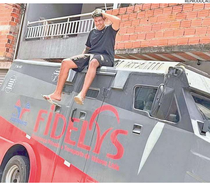
Influencer brincou ao dizer que faz corridas com blindado

nheceu que poderia ter problemas com a lei ao rodar com o carro-forte como um veículo comum nas ruas: “A dor de cabeça vai ser grande”. O jovem é administrador do perfil “O carro chefe”. No perfil, ele se define como “referência em leilões” e compartilha a aquisição de inúmeros veículos. Segundo o Código de Trânsito Brasileiro, “a compra de um carro-forte é restrita a empresas e instituições devidamente autorizadas pela Polícia Federal, e que possuam a necessidade e autorização para realizar atividades de transporte de numerário, bens e valores”. ✖