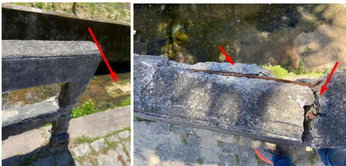
Foto 5 - Guarda-corpo de concreto danos estruturais