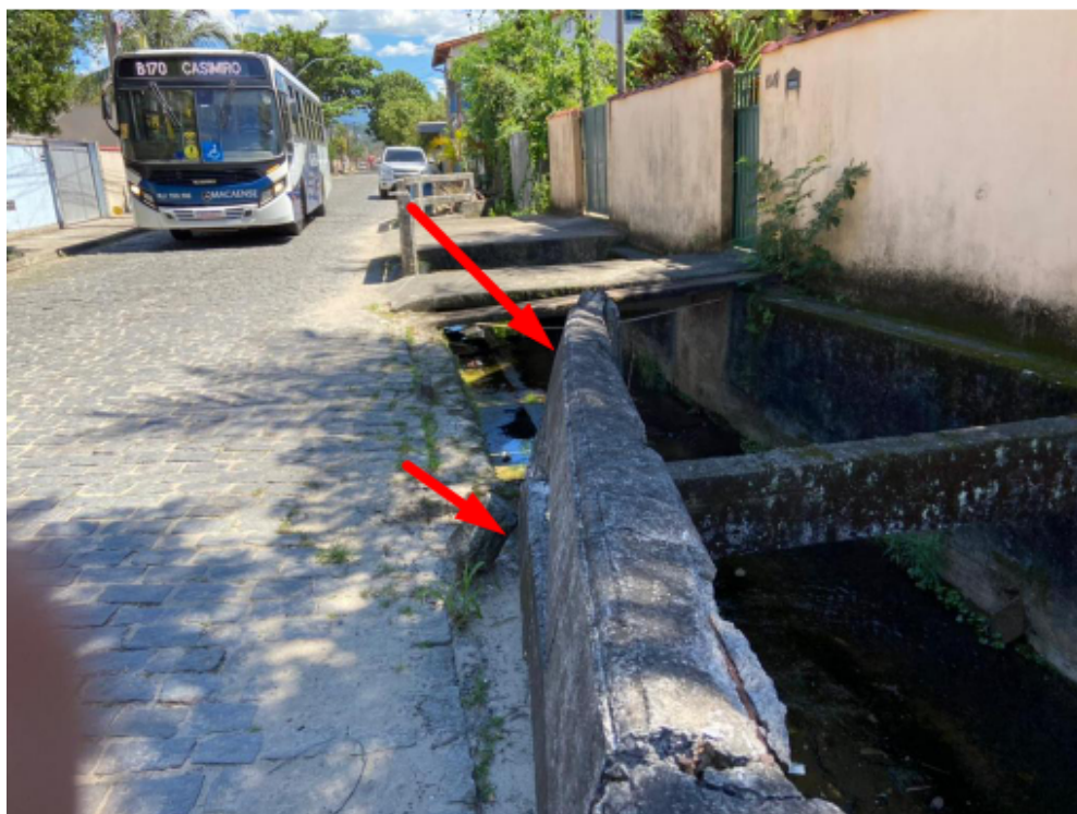
Foto 2- Início do guarda-corpo de concreto danificado