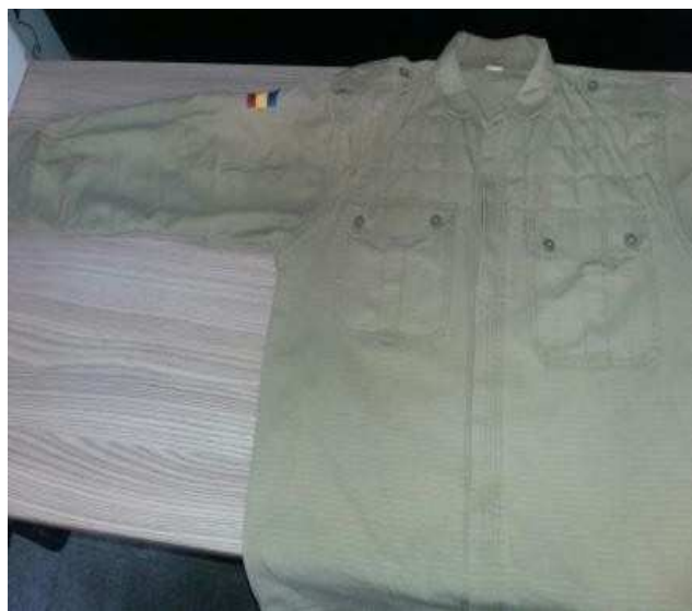
*Figura meramente ilustrativa.